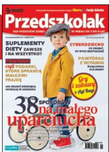
STYLIZACJA: MAŁGORZATA SNOWACKA