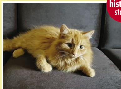
Zrobiłam to z miłości. Chciałam pomóc dwóm nieszczęśliwym istotom. I udało się.